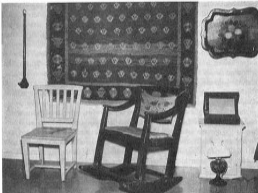
Vanha puntari seinällä. Tuoli on Kuokkalasta viime vuosisadalta, kelnutuoli vuodelta 1812 Jaran talosta ja satulipeili samasta talosta. Seinällä lempäitäinen vihki- ryijy noin vuodelta 1880. Tällaista kalustoa oli myös palaneessa Lempoisten kylässä.