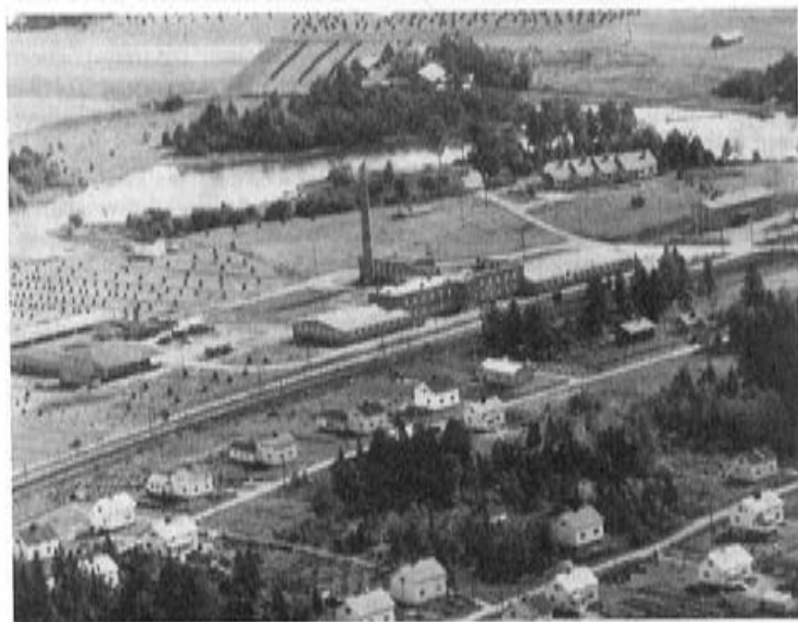
Lempäälän kaunita viljavia vainioita, omakotitaloja ja Oy Katepalin tyylikäs tehdasrakennus.

(Lähteet: Asiakirja n:o 125 Ikalis, Valtionarkistossa. Lempäälän kirkkokokousten pöytäkirjat Hämeenlinnan Maakunta-arkistossa.)