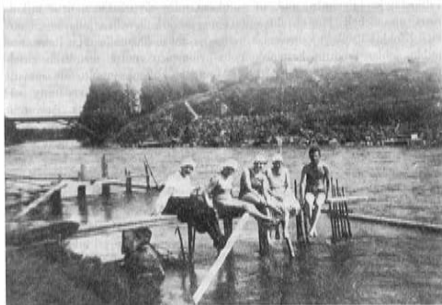
Rikalán kanavalla aiottiin yhdistää Vanajaveden ja Pyhäjärven vesistöt. Ajatus toteutettiin kaivamalla Lempäälän kanava. Kuvassa Kuokkalan kosken vanha silta v. 1916. Taustalla Hiidenmäki.

johdosta työt Rikalassa lopetettiin huhtikuussa 1789, mutta niitä oli tarkoitus jatkaa myöhemmin. Sodan päätyttyä seuraavana vuonna ei kuitenkaan ryhdytty jatkamaan kanavatöitä, vaan ne päätettiin jättää toistaiseksi. Kun kaikki tarvikkeet kuljetettiin pois ja rakennuksetkin purettiin, merkitsi tämä sitä, että koko yrityksestä luovuttiin. V. 1797 oli työmaa kokonaan selvitetty. Että näin kävi, siihen oli ainakin osaltaan vaikuttamassa säätyjen edellämainittu suhtautuminen asiaan vuoden 1786 valtiopäivillä, joilla kuninkaan vastainen mieliala ilmeni eri tavoin. Nyt on paikalla muistona yrityksestä vain osittain kaivettu hiekan umpeen mennyt kanava ja valtion omistukseen pyykitetty noin 40 metriä leveä ja 2 km pitkä kanava-alue. Valmiiksi hakatuista kivistä kerrotaan ainakin osan tulleen kuljetetuksi Lempäälän kirkkomaan kivialtaan. Kun Mattilan pysäköitä kuljetaan Pyhäiltöön menevää kylätietä pitkin 300—400 metriä, saa paikkakunnan talollisten viime vuosisadan lopulla kanavauoman yli rakennuttamalta kivisillalta jonkinlaisen käsityksen siitä, minkälaiseksi kanava oli aiottu.