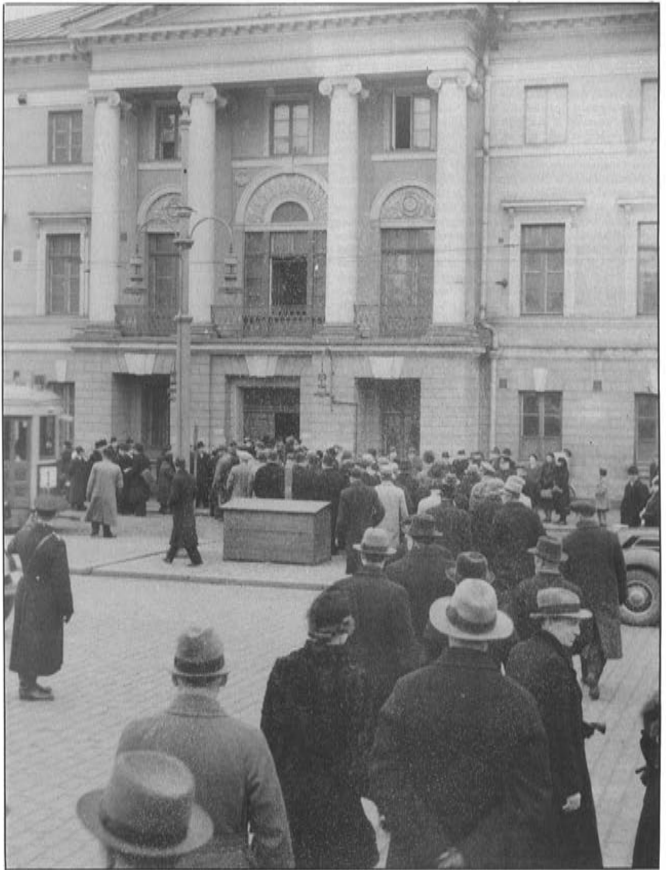
Syytetyt IKL:n edustajat menossa Helsingin raastupaan keuhkokuumeen 1939.