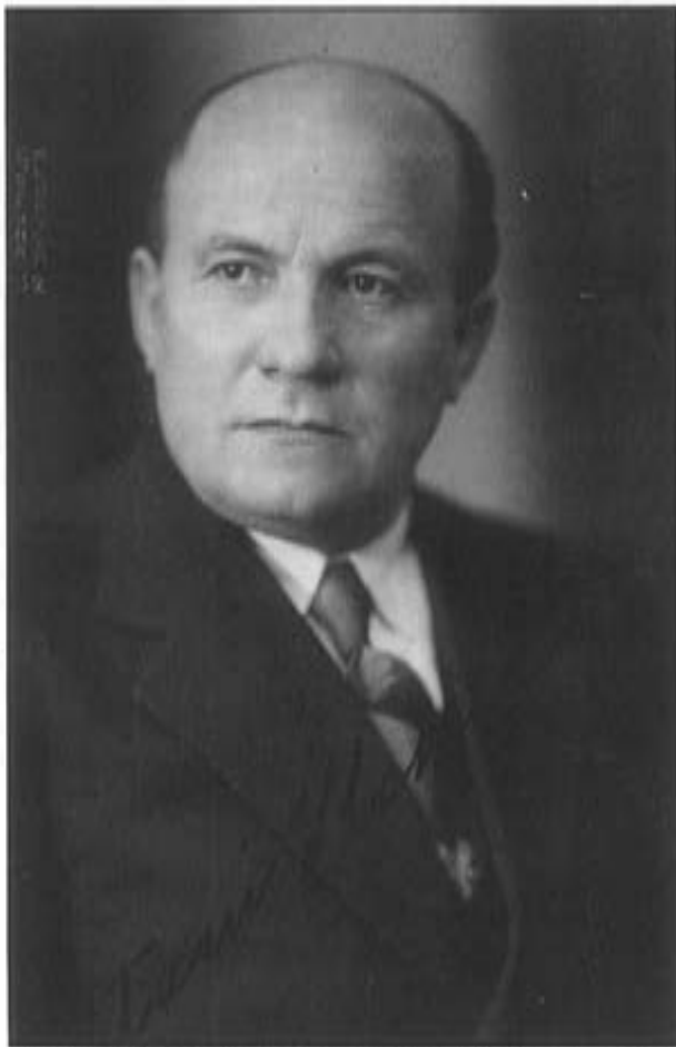
Vihtori Kosola vuonna 1932. Kuvan takana teksti: Tulen sinne ensi perjantai aamuna, josta pyydän Teidän Herra At-ralle ilmoittamaan. Tervehtien Vihtori Kosola