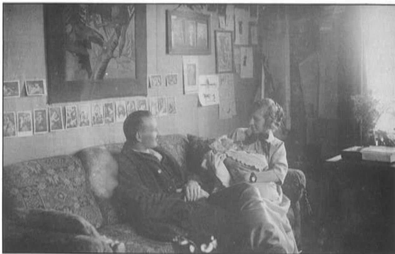
Nuorta perheonnea Lempäälän kodissa.