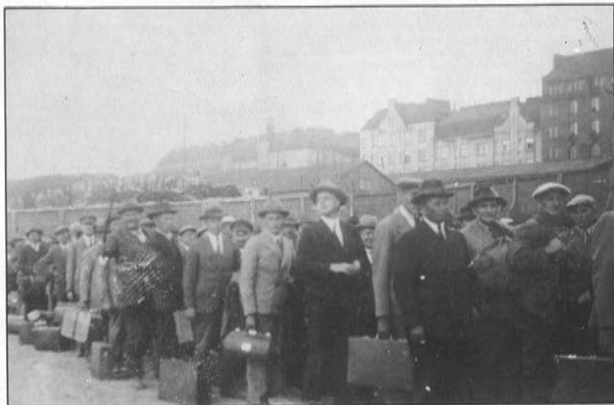
Lempääläiset talonpoikaismarssiin osallistuneet jonottamassa majapaikkaan.

Sitten tuli vuosi 1939 ja ylimääräisten kertausharjoitusten aika. Olin silloin nuori vänrikki ja minulla oli taistelulähetä,