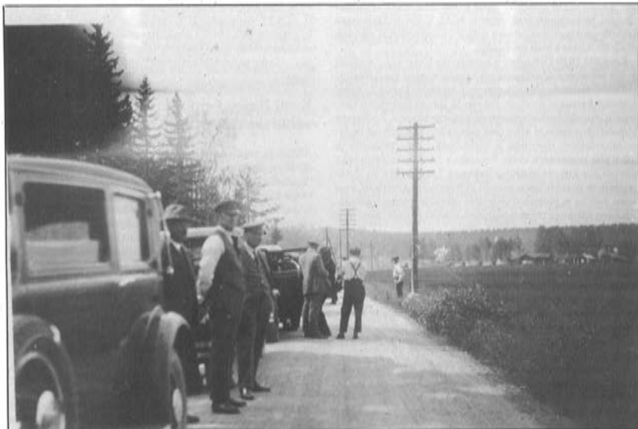
Lempääläiset menossa talonpoikaismarssille Helsinkiin autolla.