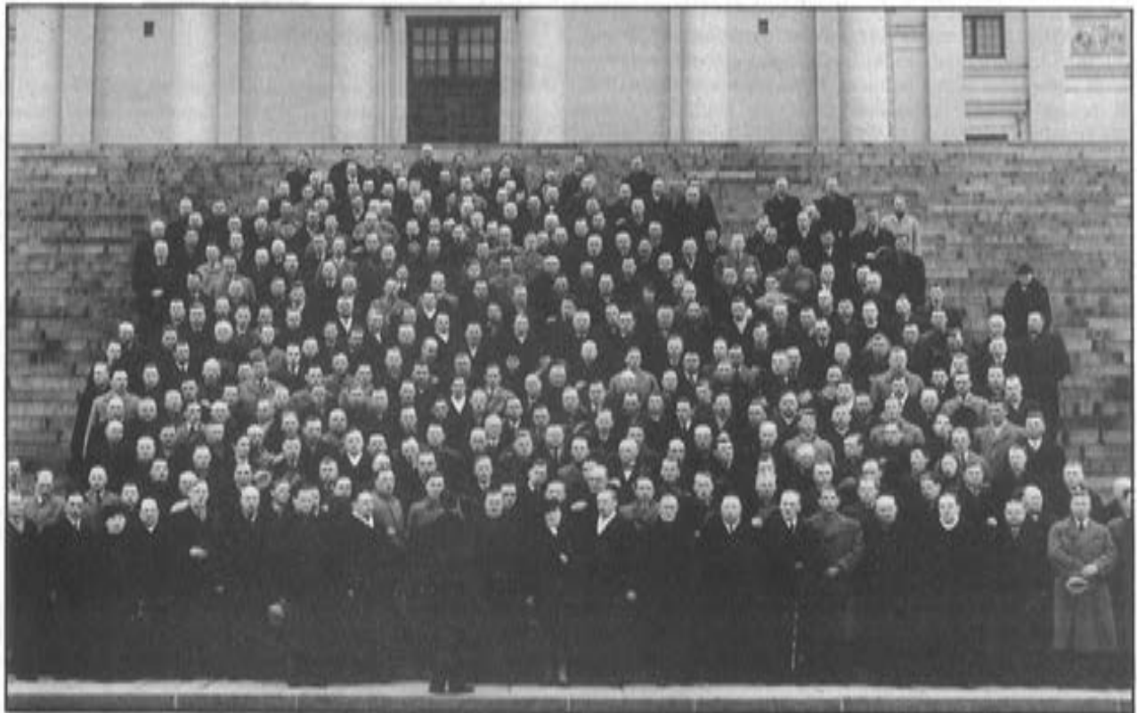
Sinimusta-järjestö otti osaa Viron oikeistoradikaaliseen vallankaappausyritykseen v. 1935 ja se lakkautettiin. Myös IKL:ää syytettiin mm. osallistumisesta siihen. Helsingin raastuvanoikeus hylkäsi jälkimmäisen syytteen 29.11. 38 ja keuhällä 1939, jälkimmäiseen tilaisuuteen kerääntyneiltä IKL:n jäseniltä suurkirkon portilla.

kin oli toistasataa. Lukioluokilla ollessani toimin Tolvilassa puutarhurina.