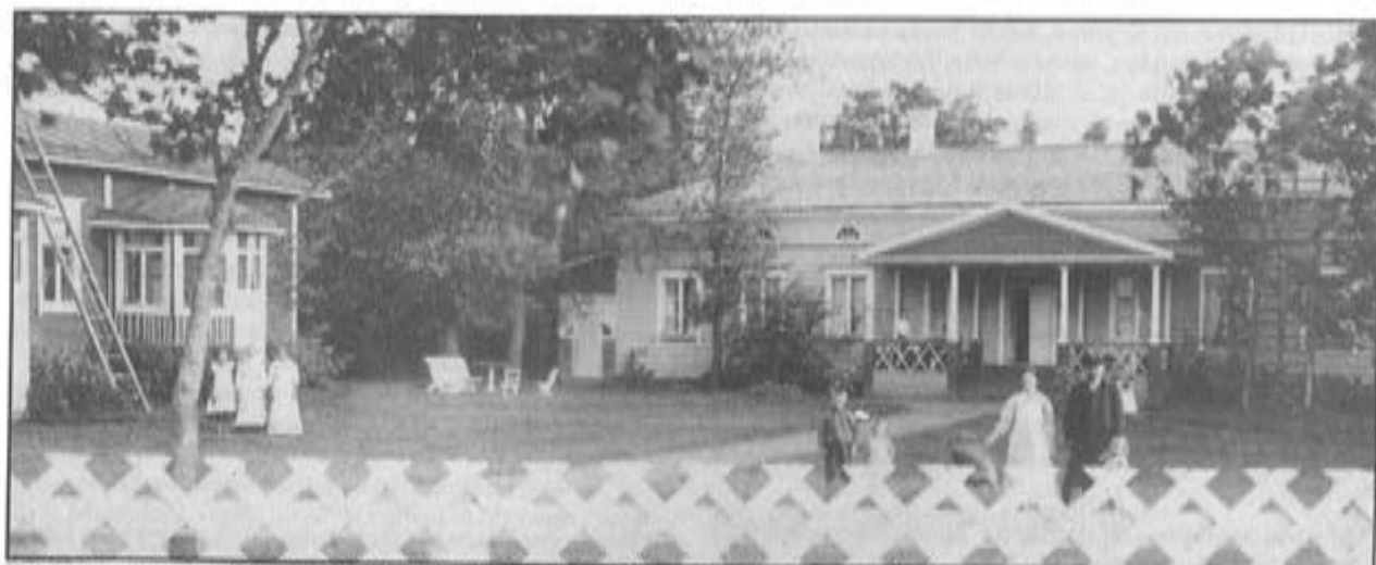
Hakkarin päärakennus Einari Niemisen omistusajalta. Kuva luultavasti vuodelta 1915.