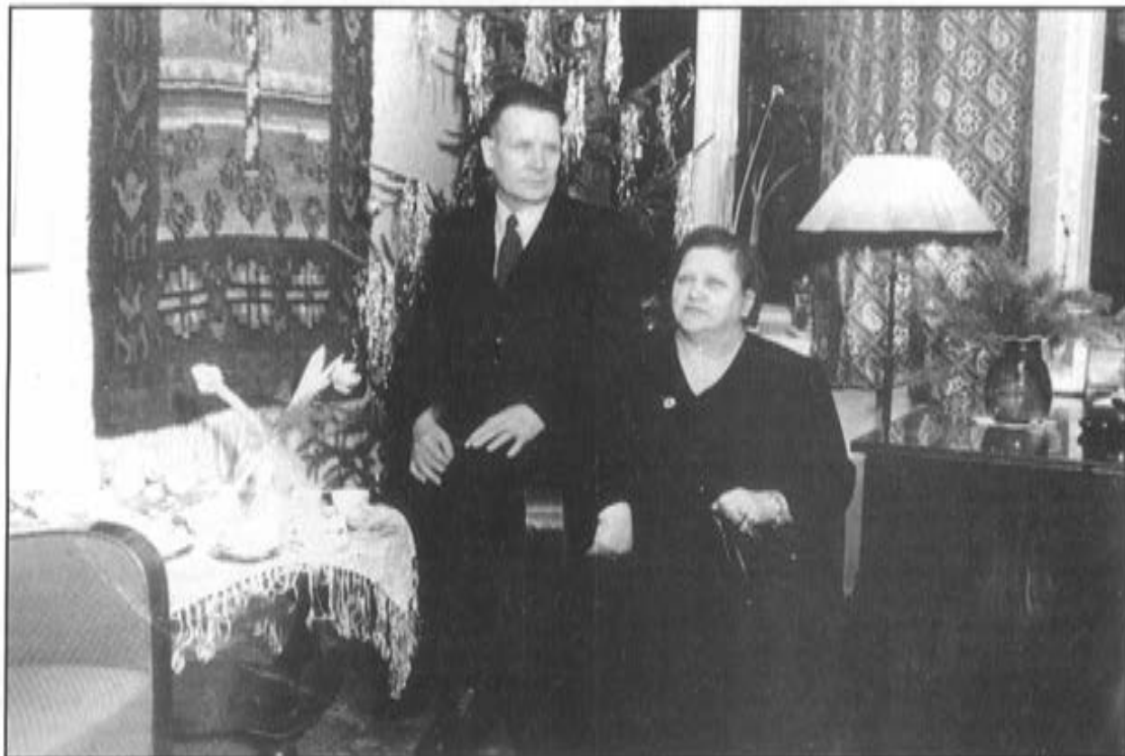
Karttuset Uuden vuoden aattona 1954.