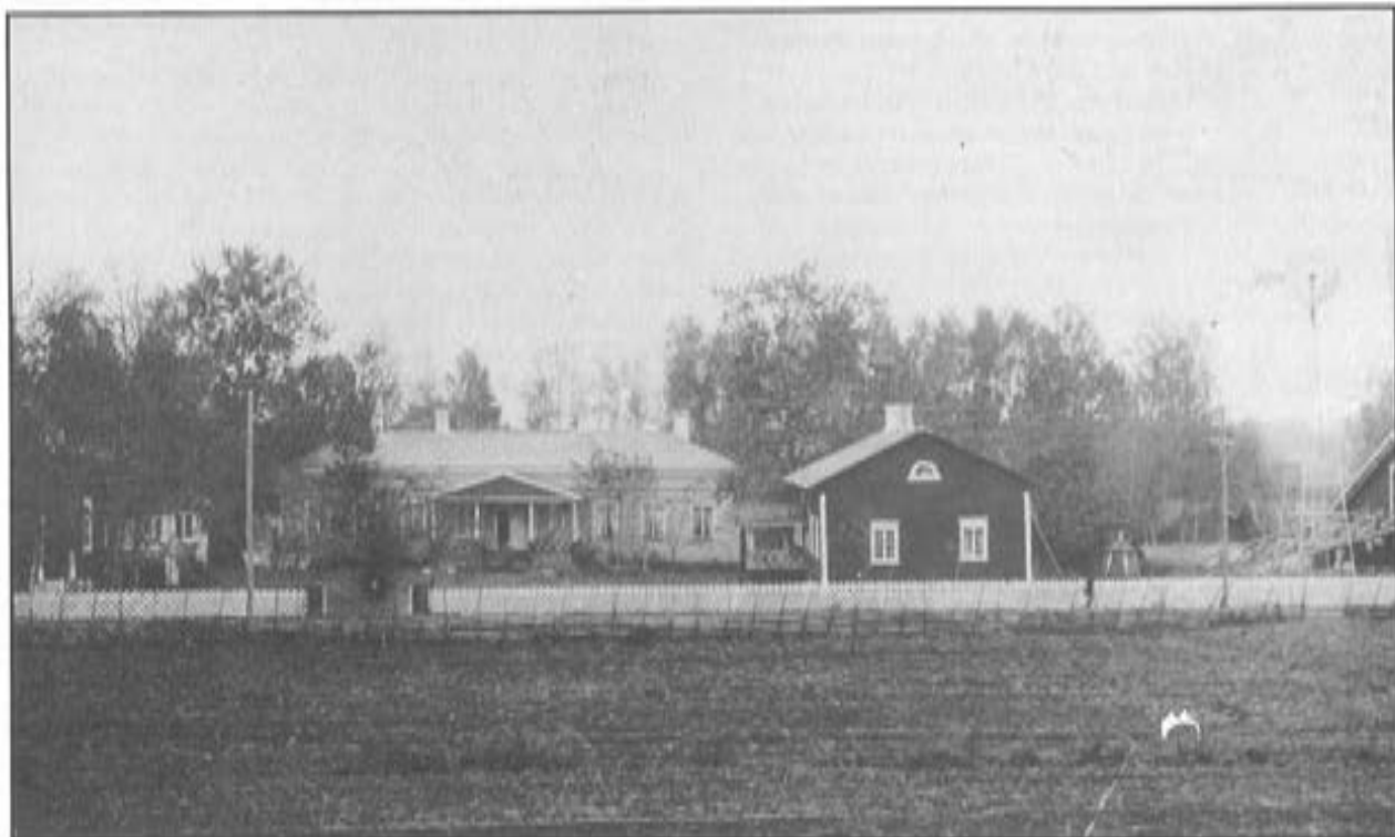
Tampere-Helsinki-maantie kulki Hakkariin päärakennuksen ohii kuvassa näkyvää aidan viertä pitkin.